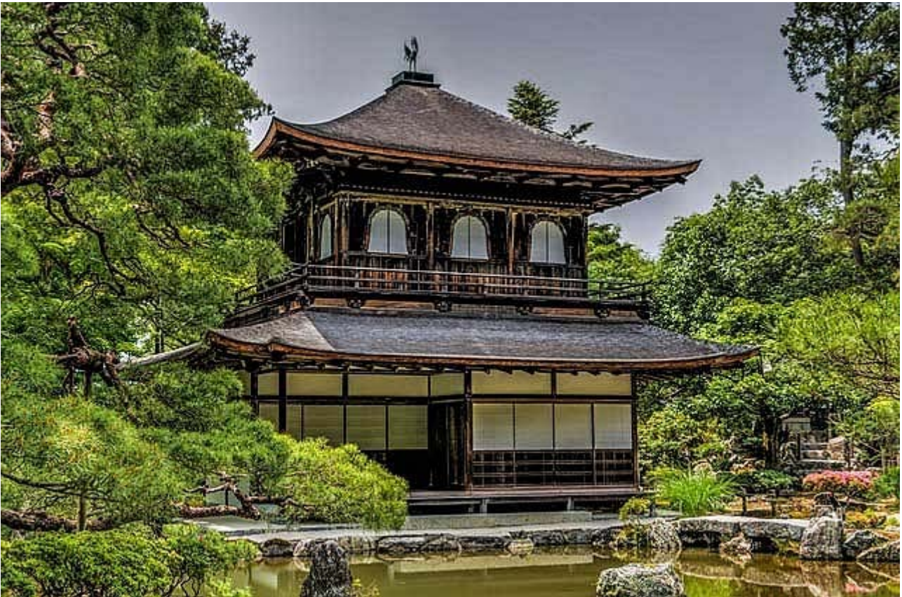
(Het silver paviljoen)

Na Yoshimasa's dood in 1490 werd de villa verbouwd tot Zen tempel. Yoshimasa was geobsedeerd door kunst, dus het is niet verwonderlijk dat zijn villa Ginkaku-ji het centrum werd van de destijds moderne kunst. Deze stroming ging de boeken in als Higashiyama Cultuur en was een tegenhanger van de gevestigde orde van de Kitayama Cultuur rond de villa van Yoshimasa's opa. De Kitayama Cultuur bleef beperkt tot de aristocratie van Kyoto, maar de Higashiyama Cultuur verspreidde zich al snel door Japan. Hieruit onstonden onder andere de theeceremonie en het No-spel.