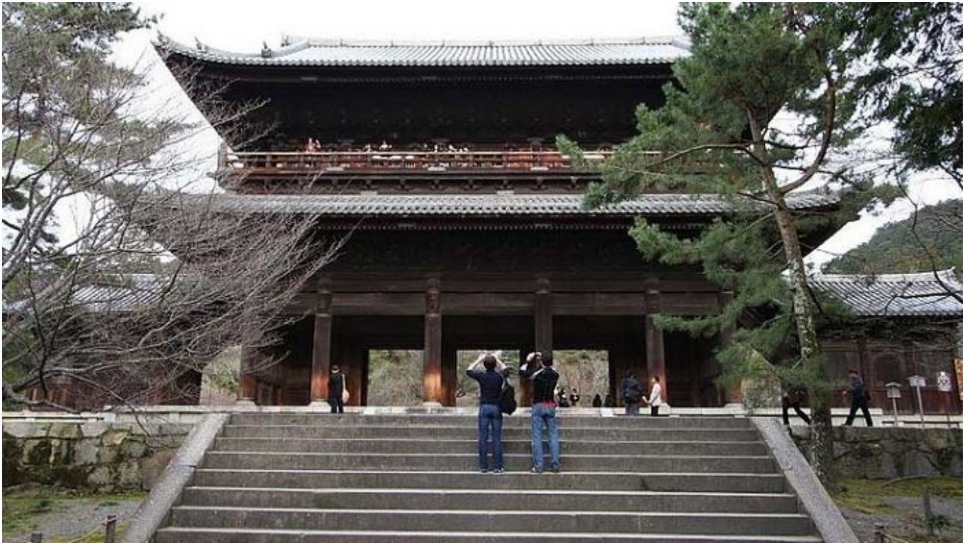
(De Sanmon poort)

zelf. Op de bovenverdieping van de poort is een observatie-dek dat toegankelijk is voor bezoekers.